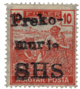
Madžarska znamka, prežigosana z znakom „Prekomurje SHS“ na poštne uradu v Dobrovniku avgusta 1919, Pomurski muzej Murska Sobota