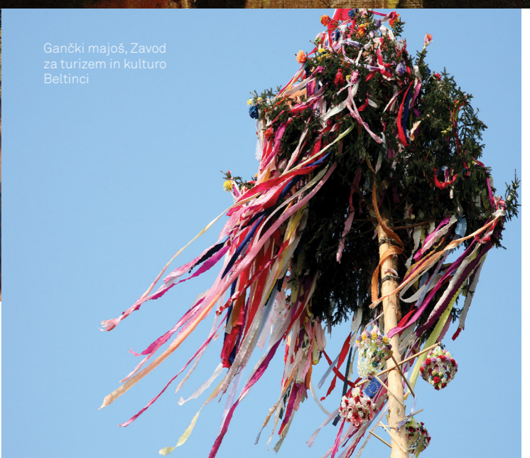
Gančki majoš, Zavod za turizem in kulturo Beltinci