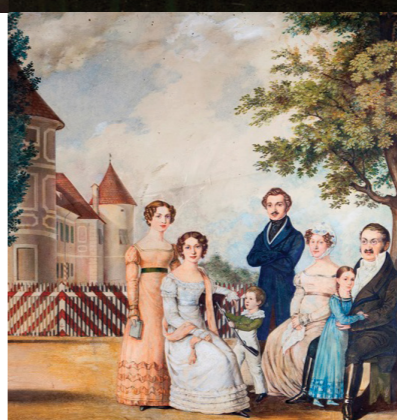
Plemiške družine v beltinskem gradu , razstava v gradu Beltinci, Zavod za turizem in kulturo Beltinci