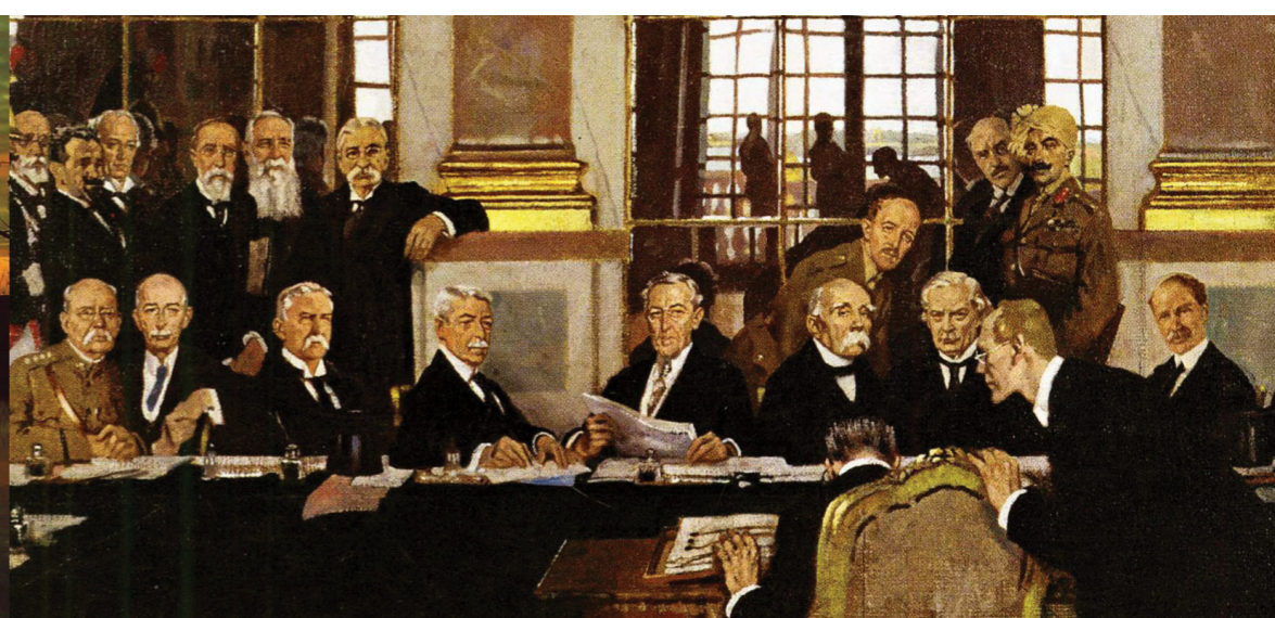
William Orpen, Podpis miru v Dvorani ogledal v Versaillesu , 1919