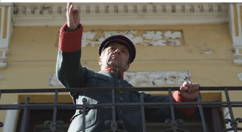
Prizor iz dokumentarnega filma Za Prekmurje gre! , režiser Štefan Celec